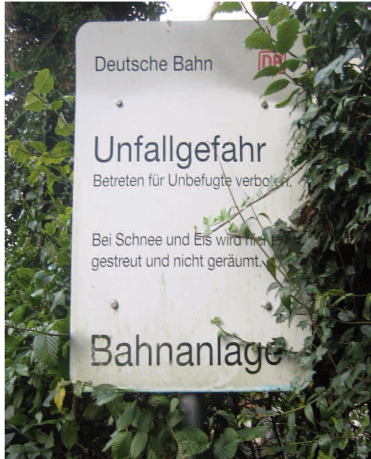
Der Bahnhof Löttringhausen ist umgebaut, am Zugang indes irritiert die Bahnfahrer weiterhin dieses Schild.

Bahnhof Scharnhorst befinden sich die Sitze am Bahnsteig Richtung Hamm direkt neben einer Weiche, wenn man dort sitzt und Züge durchfahren, spürt man eine starke Erschütterung. Hier sollten die Sitze versetzt werden.