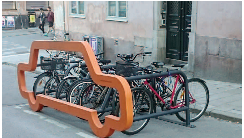
Kein Park(ing) Day, sondern Alltag in Stockholm: Ein Fahrradständer ersetzt einen Parkplatz in der schwedischen Hauptstadt.

Alternative Antriebsformen sind wichtig für den Klimaschutz, neue Verkehrskonzepte für die schnelle und umweltfreundliche Mobilität. 25 Prozent der CO 2 -Emissionen in Deutschland sind verkehrsbedingt und das leider – entgegen aller politischen Bekundungen – mit steigender Tendenz! Wir brauchen aber auch ein Umdenken darin, wie wir unsere Straßenräume nutzen und für wen. Ein E-Auto hat keinen geringeren Platzbedarf und ist auch nicht für alle erschwinglich. Wir brauchen sogar zusätzliche Ausstat-